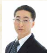
監修/医学博士 永田孝行先生