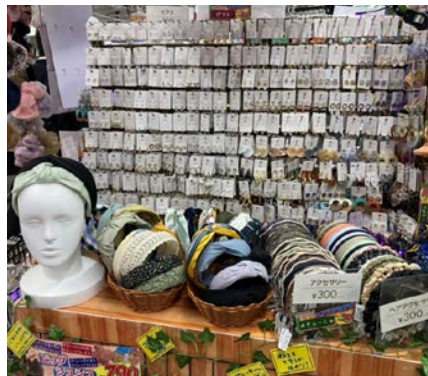
ドン・キホーテ立川店