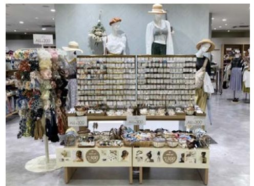
mico nico 恵那店 (岐阜県恵那市)