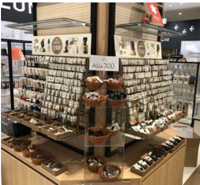
R.O.U イオンモール盛岡店