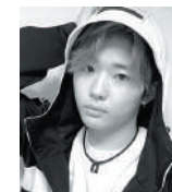
Shoa Arii プロ格闘家 K-2 GP 2019軽量級優勝