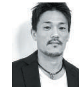
Yuki Kyoutani プロ格闘家