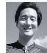
Kent Tagashira JTA公認プロテニス選手