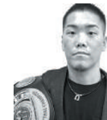
Hiroto Yamaguchi プロ格闘家 WPMF世界スーパーライト級王者