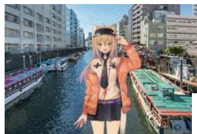
宝山レオ 当社のコーポレートキャラクター 広報としても活動中