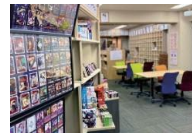
ブックマーク浅草橋 ボードゲームプレイングギャラリー」として ボードゲームスペースとギャラリーの融合施設 点