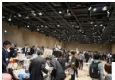
カフェレオキャラクターコンベンション 年 2 回開催する当社主催の招待制の商談会 キャラ クターグッズ専門としては国内最大級