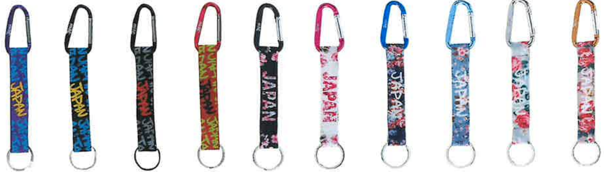
KT003-D F G N Q R S T U V