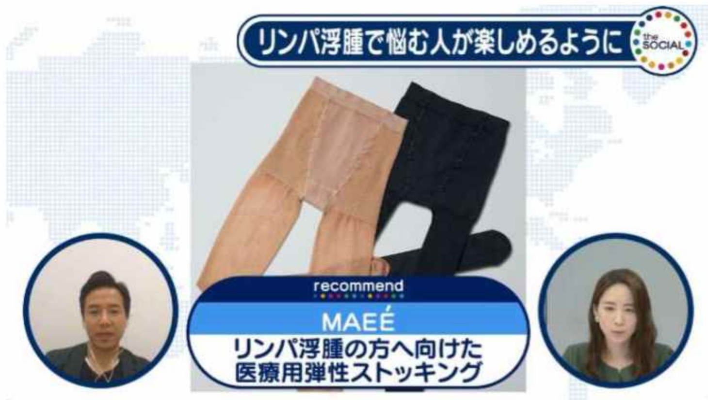
日テレNEWS24「the SOCIAL」 (2020/11/25放映)