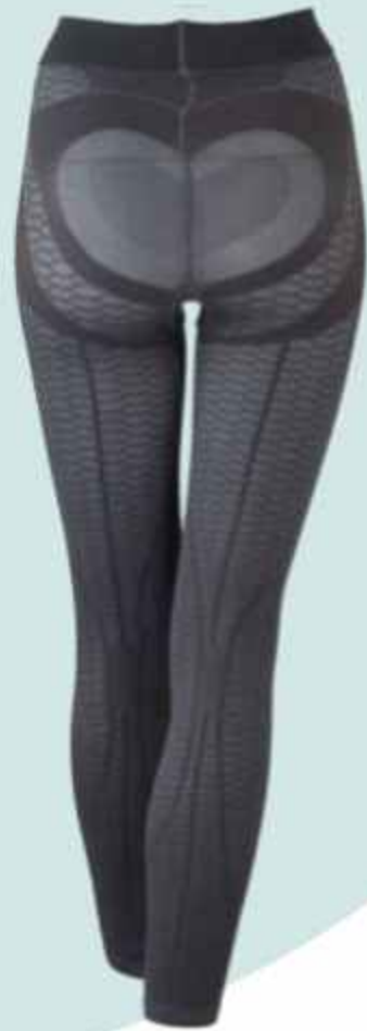
マイクロタッチレギンス