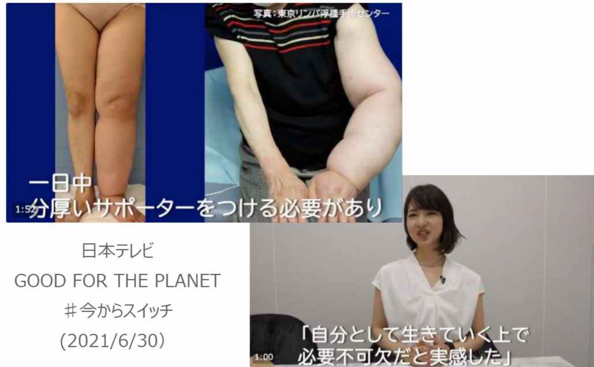
日本テレビ GOOD FOR THE PLANET #今からスイッチ (2021/6/30)