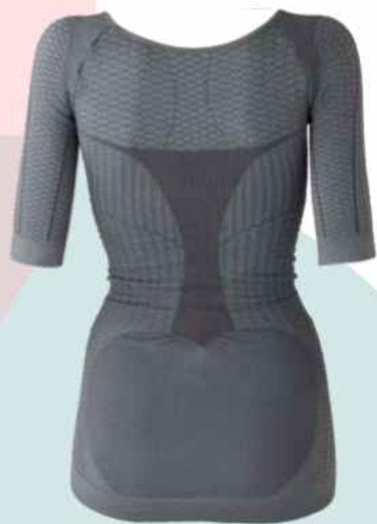
マイクロタッチインナー