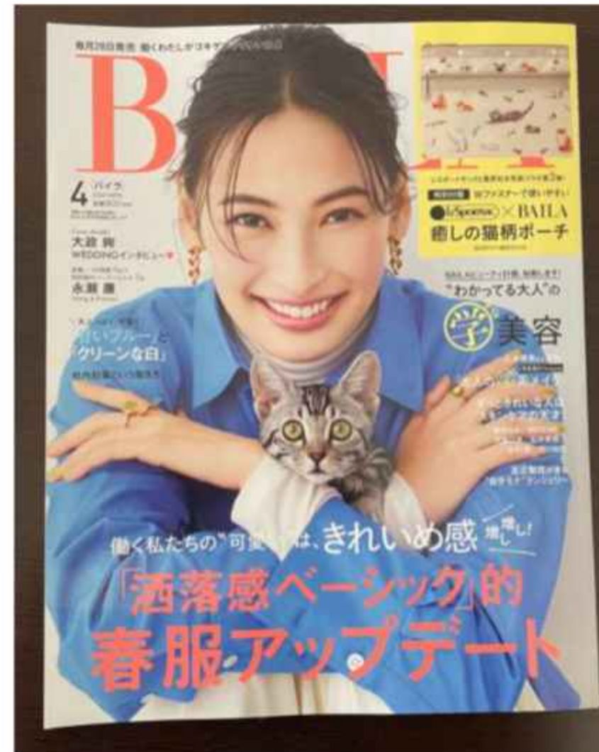
『BAILA 4月号』 (2023/02/28)