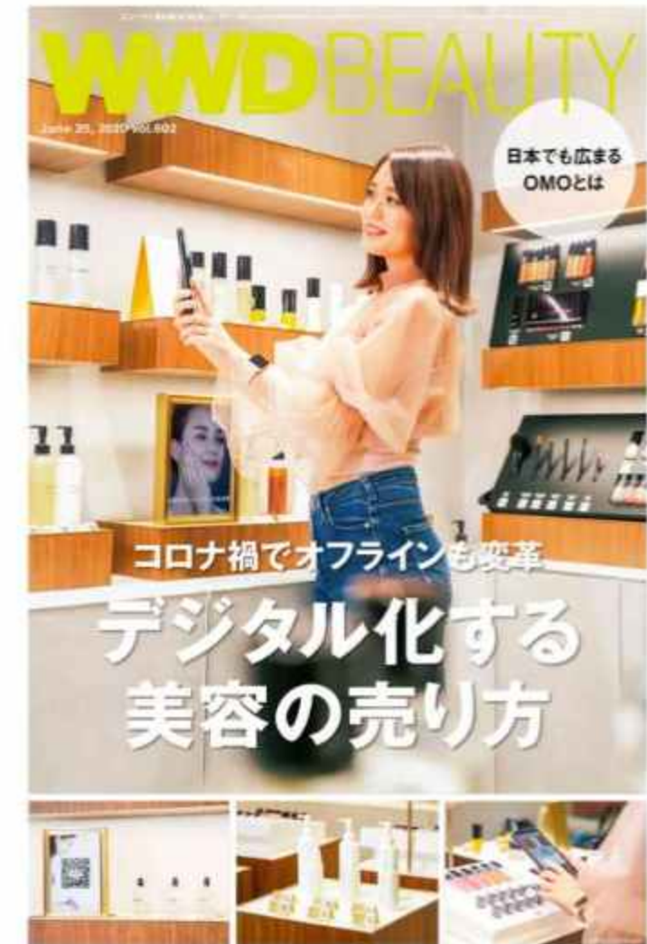
『WWD BEAUTY 6月号』 (2020/6/25)