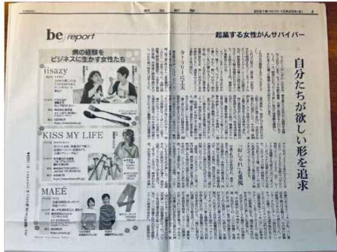
朝日新聞 『be on Saturday』 (2021/10/23掲載)